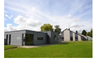
Rue de Borlon 1a Bonsin 086/34 45 46