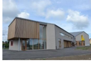
Rue des Chasseurs Ardennais 16 Noiseux 086/32 27 21