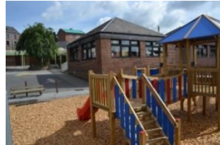
Rue du Tilleul 1 Somme-Leuze 086/32 27 22