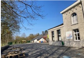
Rue de l'Eglise 13 Heure 086/32 25 35